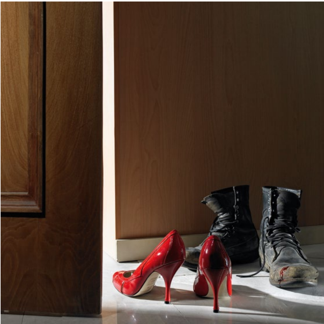
Nil, Nil (2008) © Shadi Ghadirian courtesy Silk Road Gallery