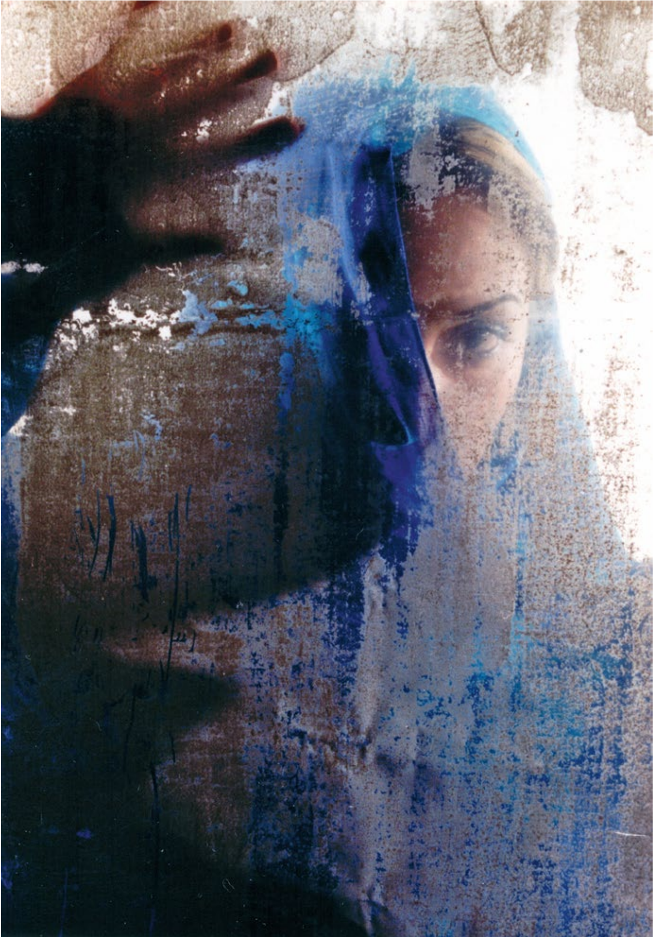
Be colourful © Shadi Ghadirian courtesy Silk Road Gallery