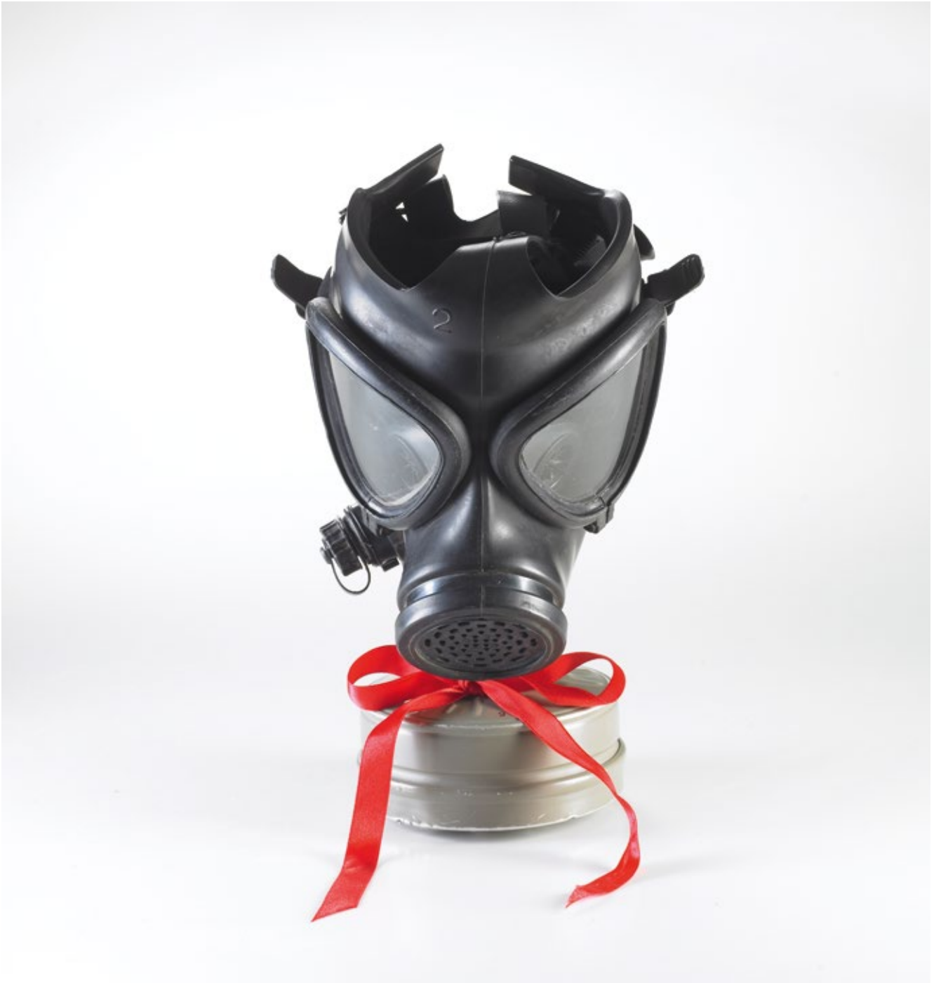
White Square © Shadi Ghadirian courtesy Silk Road Gallery