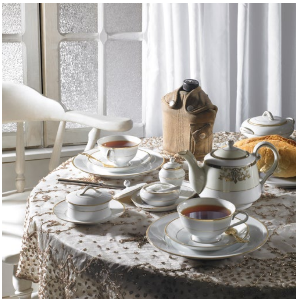
Nil, Nil

Photographe de renommée internationale, «figure phare de la scène artistique iranienne» Shadi Ghadirian est née en 1974. Elle étudie la photographie à l'université Azad de Téhéran puis commence un travail photographique dès 1998 où elle dénonce sous forme d'icônes métaphoriques le statut de la femme iranienne. Ses réalisations sont nourries de nombreuses références historiques et d'une connaissance approfondie de la société iranienne mêlant adroitement poésie et dérision.