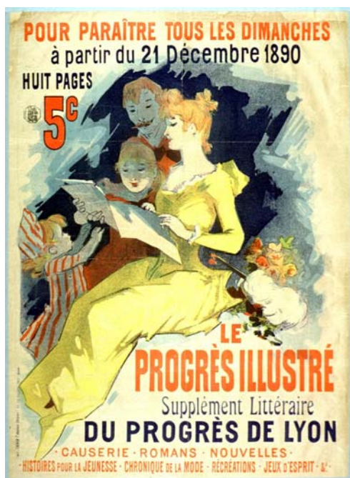
la presse illustrée au XIXe siècle