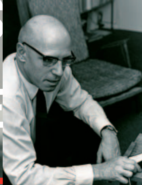
Michel Foucault.