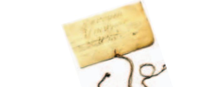
Billet trouvé sur enfant abandonné (Musée Flaubert et d'histoire de la médecine CHU-Hôpitaux de Rouen)

Entrée libre et gratuite dans la limite des places disponibles.