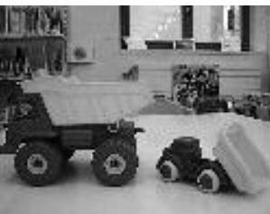
C'est quoi ton métier ?