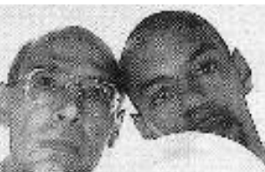
La Prophétie du brin d'herbe