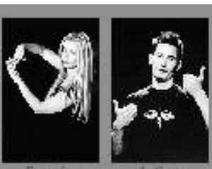
Nos loups !