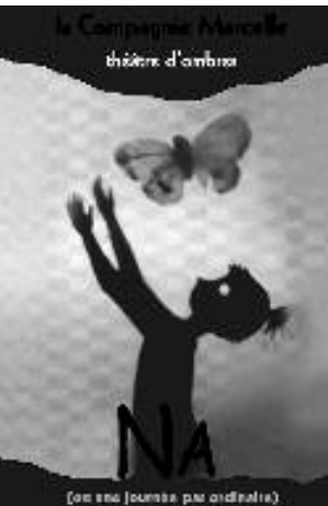
Na ou une journée pas ordinaire