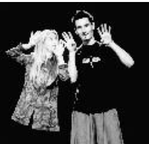
Nos loups !

mercredis 8 novembre & 13 décembre à 10h pour les enfants de 0 à 3 ans à 10h45 pour les enfants de 3 à 6 ans (sur inscription pour les crèches les mercredis 22 novembre et 20 décembre)