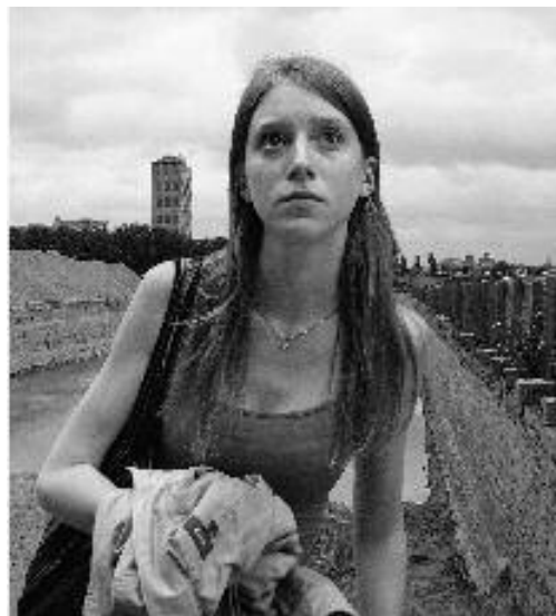
Série : Station, 2005, photographie couleurs, 85 x 71 cm

projection dans l'exposition du film de Vincent Debanne et Benjamin Blanc Dans le sens de la marche (2006, 14 mn)