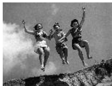
Mon vieux copain, la vie est belle...

Texte : Éric Sadin Mise en scène : Pierre Germain Musique : Éric Ferrand Jeu : Michel Legouis Voix : Pauline Hercule Visuel : Pauline Hercule, Pierre Germain