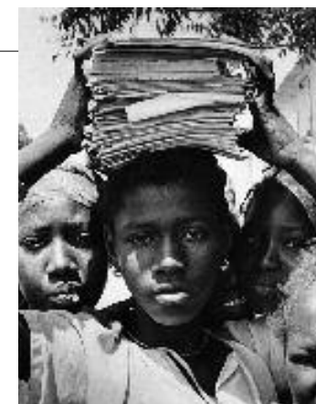
Diourbel, Sénégal, 1981

Cafés amers au Liban . Éditions du Cerf, 1985 ; Louisville, Kentucky , Belfond 1990 ; Le miroir allemand , Éditions Desclée de Brouwer, 1996 ; Lumières sur Saïda , Éditions Desclée de Brouwer, 1996 ; Irlande, la rebelle , Belfast, 1969-1999, L'Harmattan, 2002 ; De Harlem à Téhéran, 1953-2004 : Cinquante ans de journalisme , L'Harmattan, 2006.