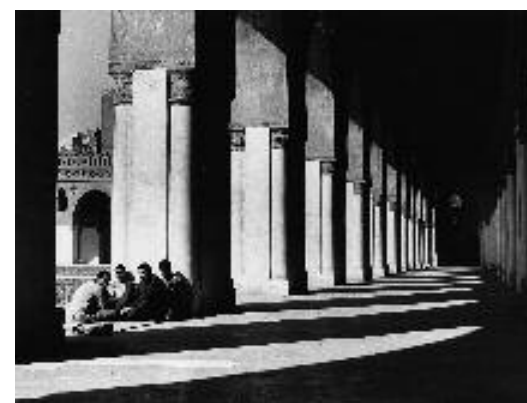
Le Caire, Égypte, 1988