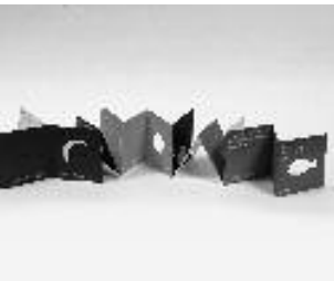
Graphisme et illustration pour la jeunesse