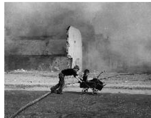
Derry, Irlande du Nord, 1972

Vincent Debanne a superposé plusieurs prises