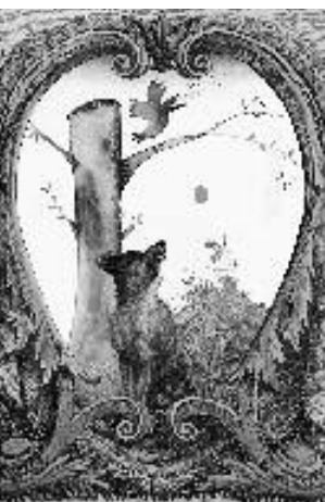
Fables en images