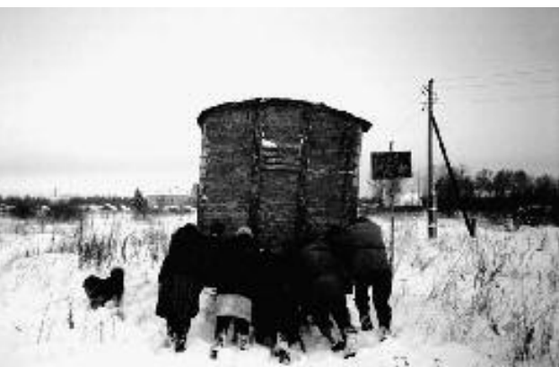
Le Jour sans pain