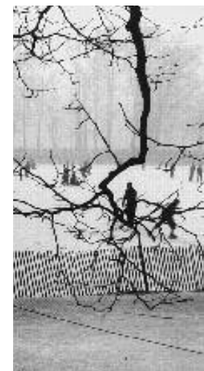
Regards sur Lyon