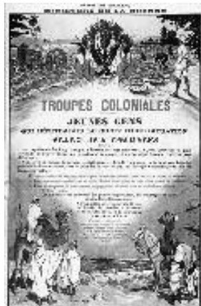
Troupes coloniales, lithographie, 1927