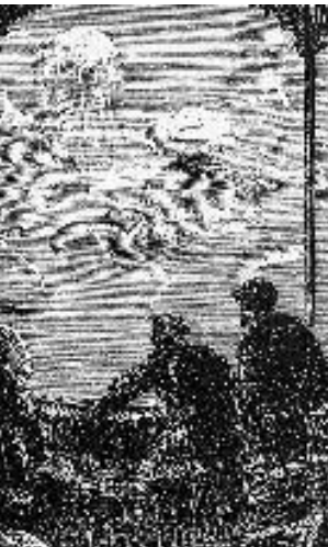
Vingt mille lieues sous les mers