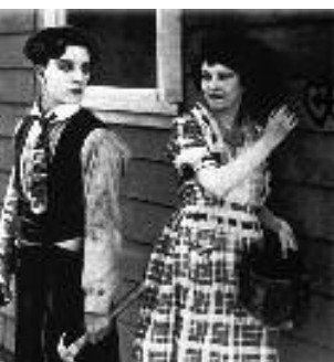
Musique pour Buster