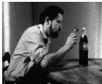
Chroniques d'une banlieue ordinaire