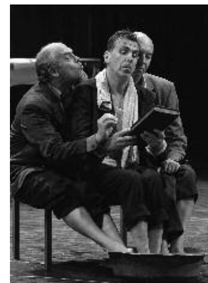
Les Barbares de Maxime Gorki, mise en scène Éric Lacascade