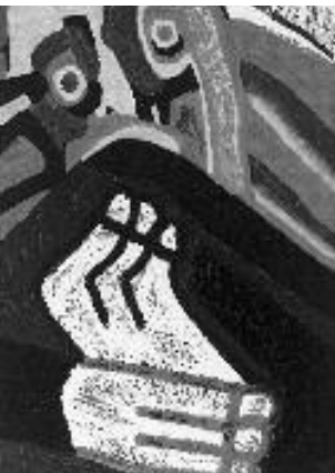
Une œuvre racontée