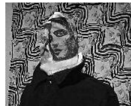
exposition Mots-Motifs-Textiles-Textes . Angers.

Le jeu du tissu, implicite, latent, par lui même interactif, marqué d'immédiateté et de vie fuyante, ce jeu intervient entre dehors et dedans, pour l'unité de soi, entre désir et pensée, entre le charnel et le spirituel, comme entre le masculin et le féminin. Il est un remarquable opérateur de cohérence, d'identité et de mémoire. P.H.